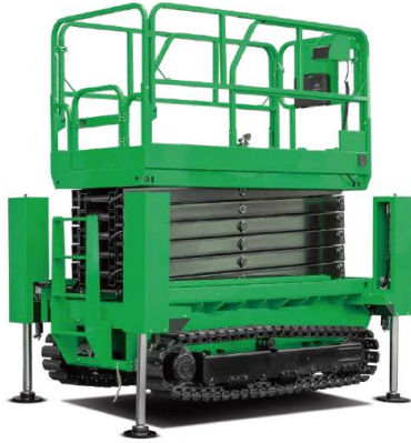
Nacelle ciseaux sur chenille