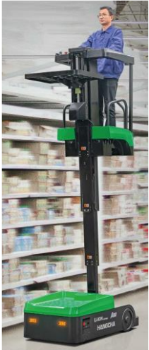
Nacelle mini à mât vertical