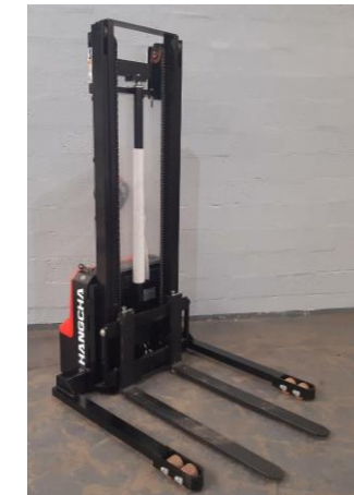
Gerbeur à bras encadrant