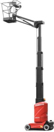
Nacelle verticale (11m)