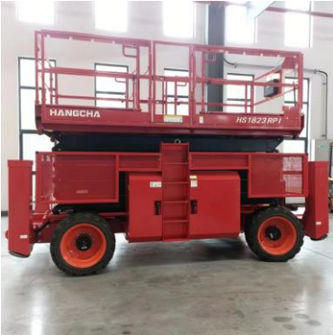
Nacelle TT ciseaux