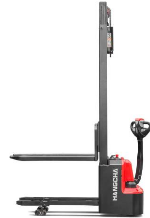
Gerbeur à levée initiale